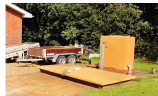
Kemitank på Hadsten Renseanlæg

Fosforen fjernes ved at tilsætte jern eller aluminium til spildevandet.