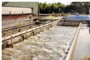
Sandfang på Hadsten Renseanlæg

Fedtet afvandes i en fedtbrønd, før det køres væk til lossepladsen.