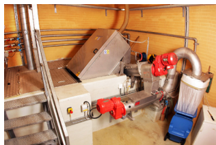
Rist på Ulstrup Renseanlæg

Først ledes spildevandet gennem en rist. Risten tilbageholder større ting som toiletteppar, bind, vatpinde, kapsler – og i visse tilfælde også legetøj og tænder. De tilbageholdte ting afvandes og opsamles i en container, før de køres bort til forbrænding.