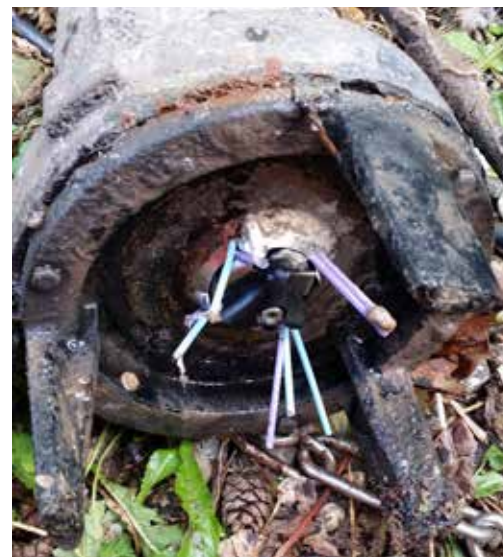
▲ Vatpinde sætter sig nemt fast i spildevandspumperne.