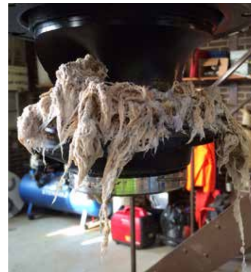
▲ En stoppet spildevandspumpe fyldt med engangsklude og hår.