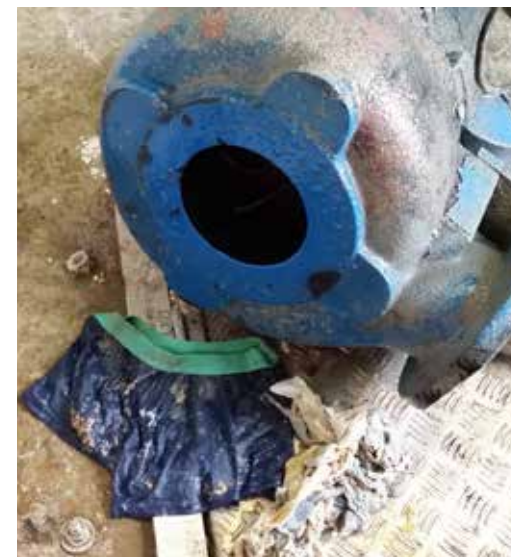
▲ Mangler du et par boxershorts? De her sad fast i en spildevandspumpe.