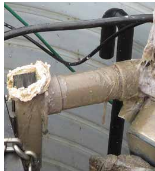
▲ Vådservietter og engangsklude har tilstoppet en pumpestation.