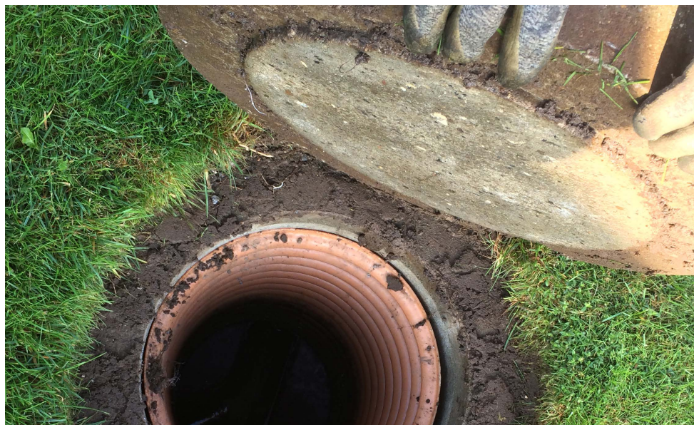
Skelbrønd. Husk at det er dit ansvar at fritlægge dækslet – ikke Favrskov Forsynings.

Favrskov Forsyning forbeholder sig ret til at aflyse arbejdsopgaven, hvis dækslet ikke er fritlagt.